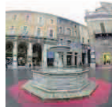
Urbino, piazza della Repubblica

La stessa rappresentazione teatrale, inserita nel progetto «E se la scuola incontra il mondo? Laboratori di cittadinanza», sarà presentata stamattina, dalle 11 alle 13, al cinema Astra esclusivamente agli studenti delle classi quarte e quinte di tutti gli istituti superiori del comune di Pesaro. Le sale cinematografica con oltre 420 tra ragazzi e insegnanti.